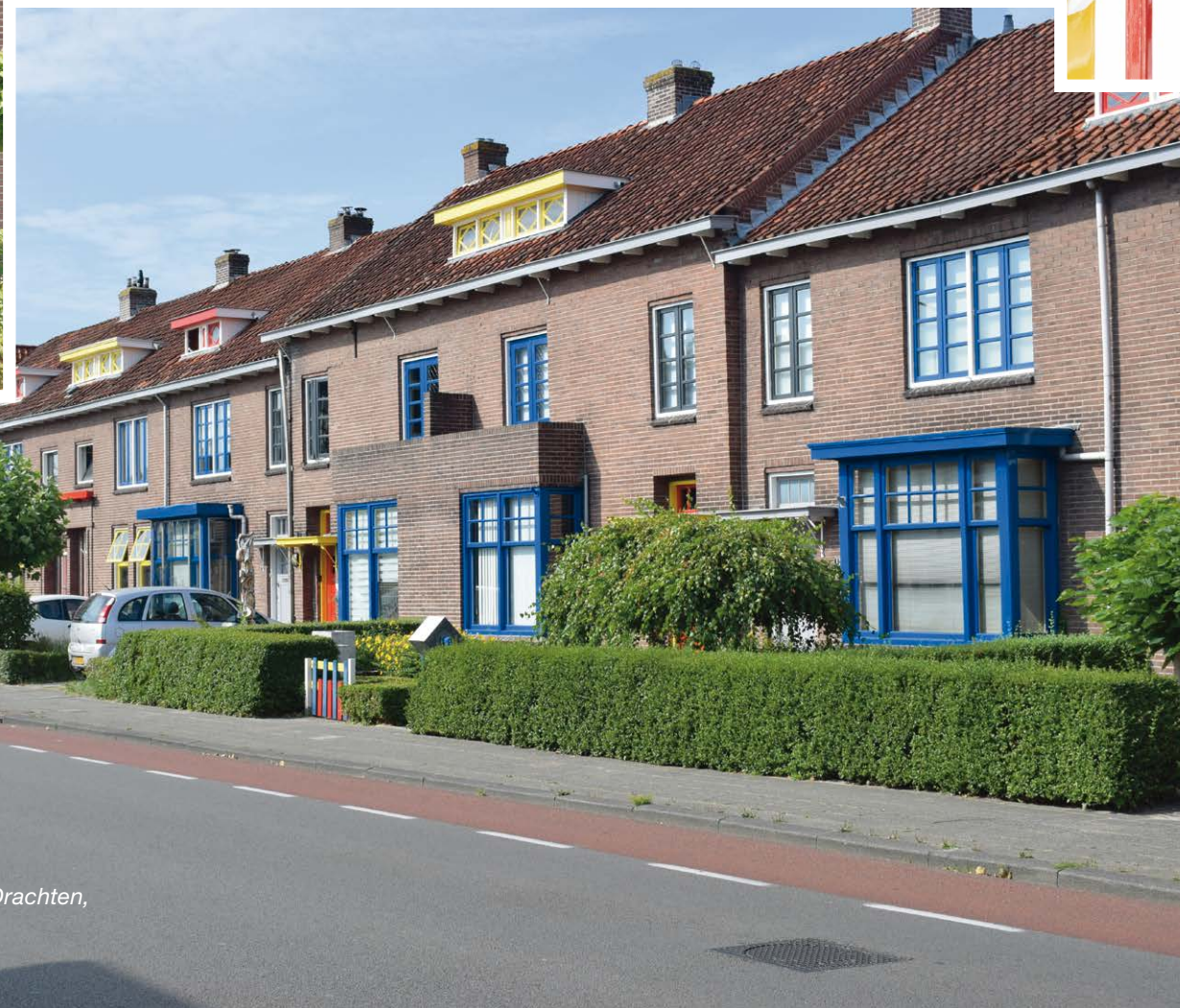
De Papegaaienbuurt in Drachten.