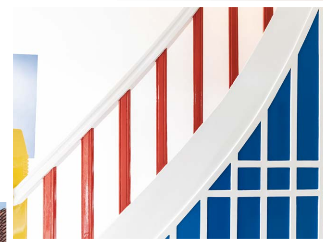
Detail van de trap op de begane grond, foto Mark Sekuur, Rijksdienst voor het Cultureel Erfgoed.