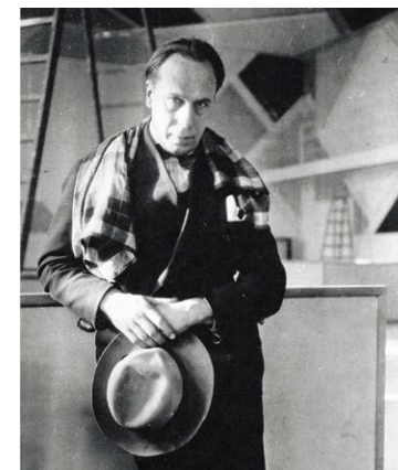
Kunstenaar Theo van Doesburg, foto Museum Dr8888.