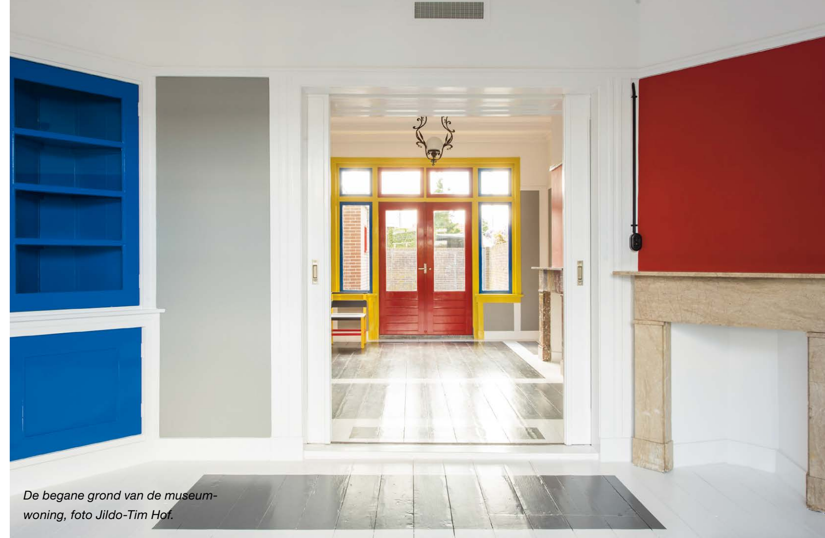
De begane grond van de museumwoning, foto Jildo-Tim Hof.

In 1988 werden de originele kleuren teruggebracht