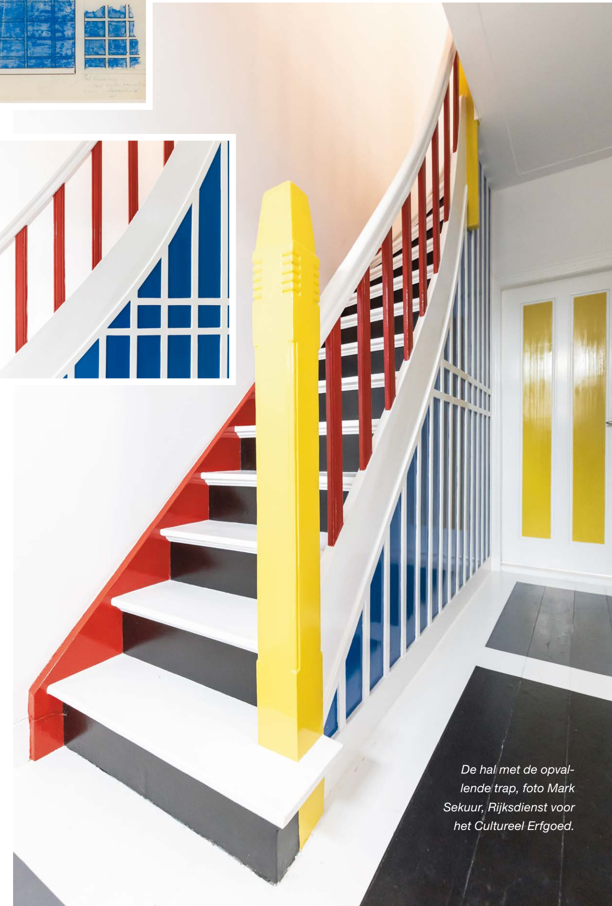
De hal met de opvallende trap, foto Mark Sekuur, Rijksdienst voor het Cultureel Erfgoed.

De buurt kreeg al snel de negatieve bijnaam 'Papegaaienbuurt'