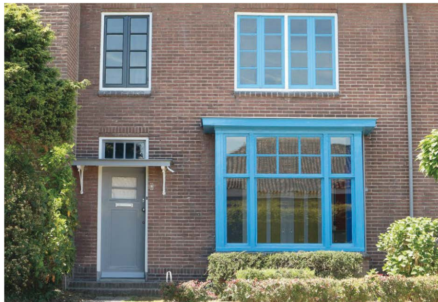
De voorgevel van museumwoning Van Doesburg-Rinsemahuis aan de Torenstraat 3